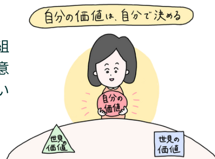
図1.自分らしさの3要素

その気づきを行動に移していくことで、仕事への満足度を上げることができ、仕事への満足度が上がると、取り組む姿勢や成果に影響し、評価されて得意分野を生み出すことができるのではないのでしょうか。(→裏面へつづく)